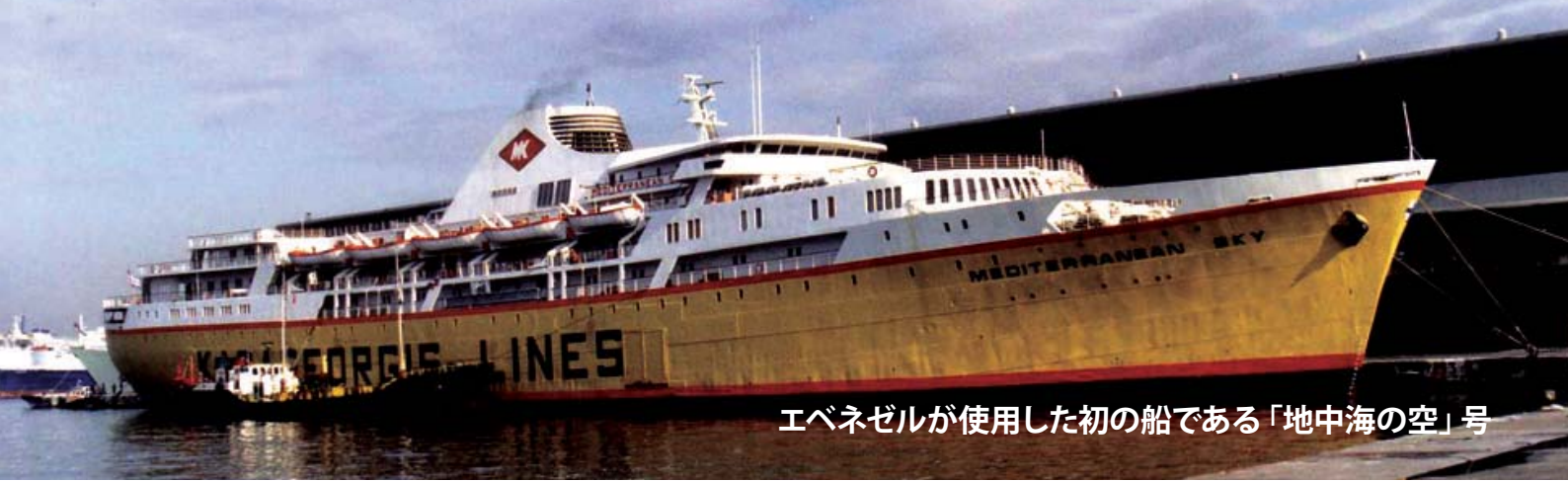
エベネゼルが使用した初の船である「地中海の空」号

このようにしてエベネゼルの働きは始まりました。ボーンマスの小さなオフィスから始まり、旧ソ連の多数の支部へと広がりました。アリヤーするための書類を整えたり、ビザ取得するのは、困難を極める時間のかかるプロセスが必要でしたが、エベネゼルのチームは粘り強く奉仕しました。そして、飛行機と船で、オリムがイスラエルへ帰還する支援をしてきました。今年の1月で、エベネゼルによってイスラエルへ帰還したユダヤ人の数は、15万人に及びます。