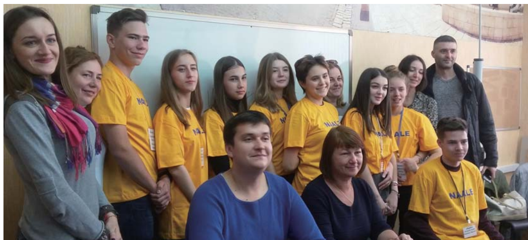
写真:エベネゼルが支援している「ナール教育プログラム」を通して、ノボシビルスクからアリヤーする若者たち