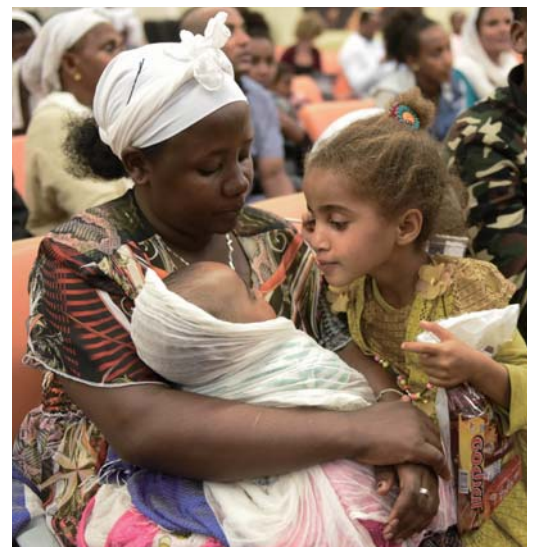
写真:エチオピア人のオリムをイスラエルへ歓迎する

このようにしてアリヤーが始まりました。ゼルバベルはまず5万人のユダヤ人を率いてイスラエルへ帰りました。全員が帰りたがっていたわけではありませんでした。中にはバビロンに定住し、そこでの生活が快適になっていた者もいました。イスラエルへの旅は、辛い危険な旅でした。