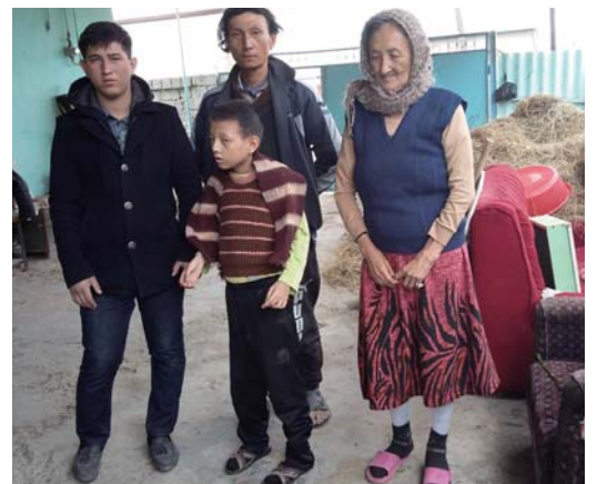
写真 悲劇の後で、新しい出発を 待ち望む

また、私たちはこの家族の必要について祈りのパートナーに伝えました。すると彼らは、冬服や靴や毛布など、この家族がアリヤー便を待つ間に提供してくれました。困難な状況でしたが、神様は忠実なお方です!