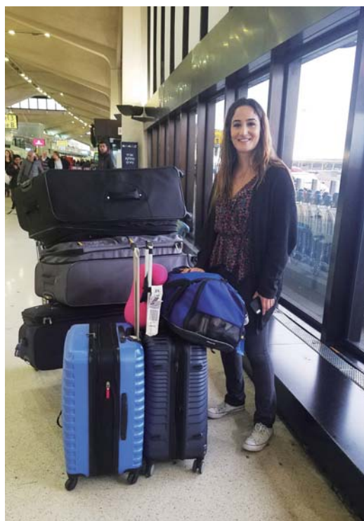
写真 タリアがイスラエルへ出 発する