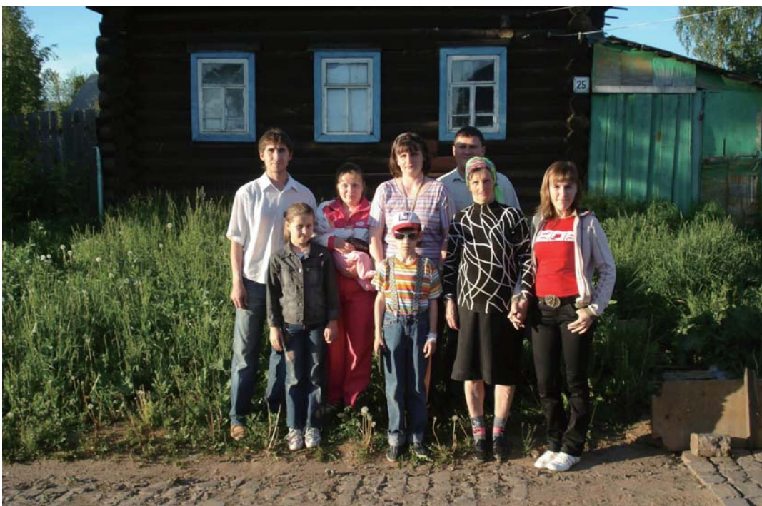
上:イスラエルのナザレの方向 下:アリヤーする前に自分の住んでいたパームの家の前で